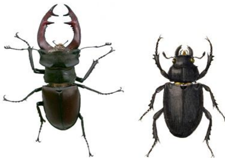
Foto 4.4. Rădașca ( Lucanus cervus ) exemplar mascul- stanga și exemplar femelă- dreapta

Dimorfism sexual accentuat. Masculii au capul mai larg decât protoracele, prevăzut cu creste transversale, iar mandibulele lungi până la o treime din lungimea corpului, prevăzute cu dinți, asemănătoare coarnelor de cerb. Femela mai mică are capul mai îngust decât protoracele, iar mandibulele nu depășesc lungimea capului.